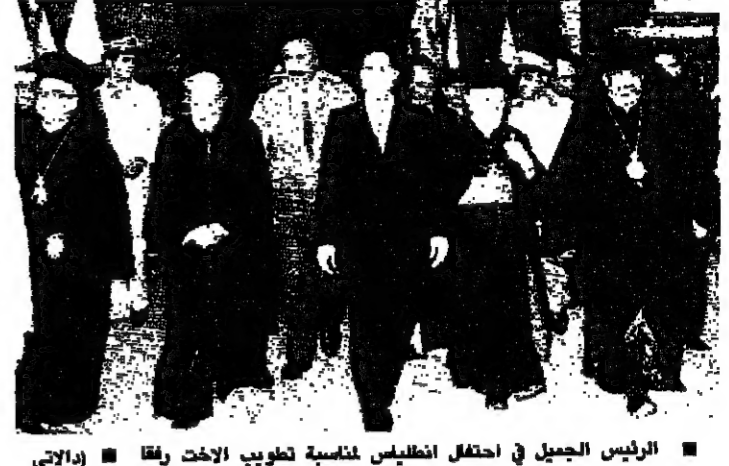
الرئيس الجميل في احتفال انطلق بمناسبة تطويب الاخوت رفقا

وقلت الوكالة الوطنية للاعلام ان عددها في الفاتيكان الذي اقامه قداسة البابا يوحنا بولس الثاني امس. في كاتدرائية القديس بطرس في روما. بلغ 15 الف شخص. تضم منهم حشود الكرادلة والساقفة والرهبان والرهبانيات. ورؤساء الوفود التي حضرت حفل تطويب الراهبة اللبنانية رفقا الرئيس. (تفاصيل احتفالات التطويب على الصفحة 4)